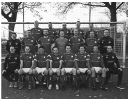
WINNAARS "STALS TROFEE 2024" RKASV 4

De Stals Trofee is dit jaar gewonnen door RKASV 4. Ze wisten de eerste zeven wedstrijden van 2024 te winnen. Hierdoor zijn ze dan ook de terechte kampioen van de "Stals Trofee" 2024. Deze wisselbeker zal op zaterdag 15 juni tijdens onze feestavond, worden uitgereikt door de familie Stals.